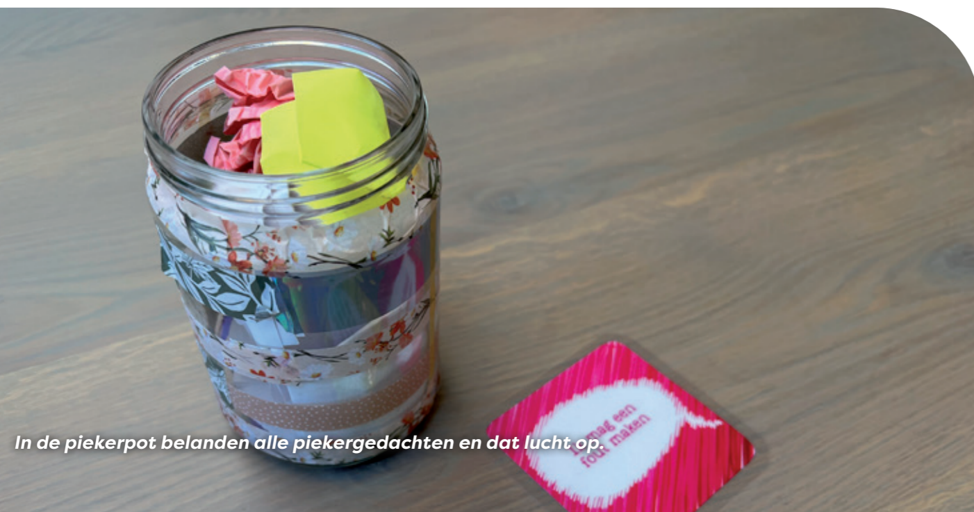
In de piekerpot belanden alle piekergedachten en dat lucht op.